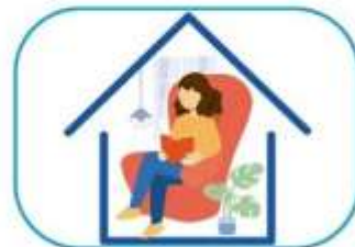
6 Quedate en casa