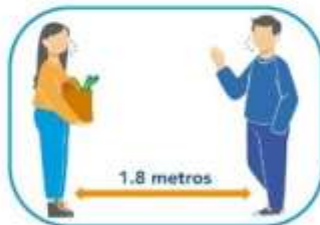
5 Distanciamiento social