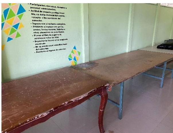
Imagen N° 1 Mal estado del mobiliario del comedor

En la visita realizada se evidenció que el comedor se encuentra en malas condiciones, se presentan inundaciones producto del desbordamiento de agua en una canoa a nivel interno que se encuentra en mal estado, además de que las mesas y sillas también se encuentran en mal estado, como se observa a continuación (Ver imágenes 1,2 y 3).