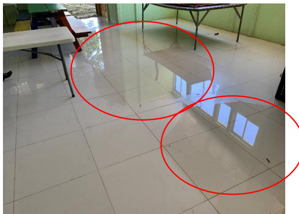
Imagen N° 3

Presencia de agua en el piso producto de la inundación del comedor y al mal estado de la canoa interna