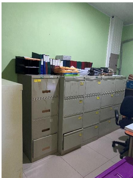
Imagen N° 4 Archivo de Documentos

Adicionalmente, las oficinas administrativas resguardan documentos en los servicios sanitarios, en virtud de no contar con un espacio exclusivo para archivar (Ver imagen N° 5).