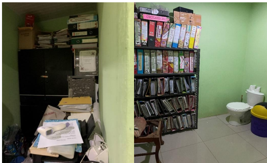
Imagen N° 5 Aglomeración de documentación en la oficina y el baño de la dirección debido al poco espacio y la poca organización

Con respecto a esta situación, mediante Informe 41-2021 Parcial-Colegios Artísticos/Prof. Felipe Pérez, se generó la recomendación 4.20 dirigida a la dirección del centro educativo, a fin de que en coordinación con la Junta Administrativa se realice un plan de trabajo para planificar las tareas de orden y limpieza de las diferentes áreas, el mantenimiento y adquisición de equipo y mobiliario que se requiere.