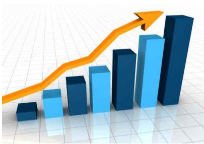
Gráfico 1 (representación de los datos contenidos en la tabla anterior. El título del gráfico es idéntico al de la tabla).