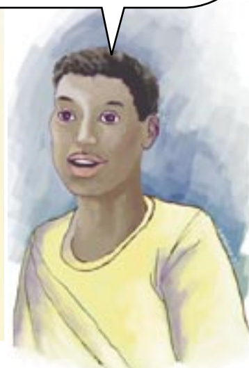
Litografía de Angelika, Guatemala.