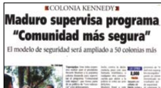
El Heraldo, Honduras, miércoles 7 de mayo de 2003

Finalmente, investigarán qué medidas de prevención se toman en su país ante esta situación y propondrán medidas que pueden tomarse a nivel personal. Cada grupo expondrá su análisis e investigación al resto de la clase.