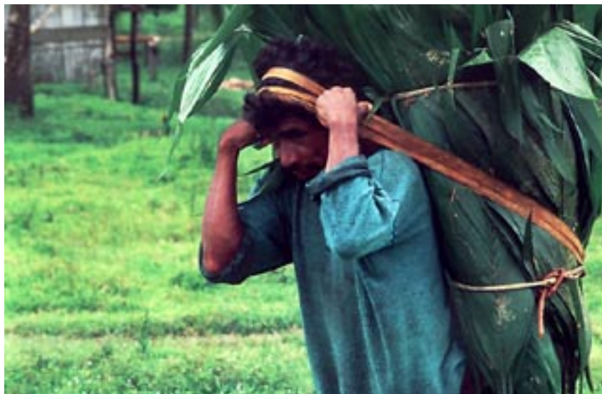
Fotografía de Edmundo Lobo, tomada del Calendario Pueblos Indígenas y Garífuna , 1995.

Indio Cruz ¡qué carga llevas por distancia interminable! ¡Cuando empezaste a sufrirla no salías de tu madre! Hay tanto que te doblega y te condena al arrastre; tanto que se ha vuelto vida de sentirlo en viva carne y de hallar, hasta la muerte, una envoltura de sales. Los mapas se han dibujado con el hilo de tu sangre; en tus muslos y tu cuello tienen base las ciudades; de tu corazón el grano cae al suelo y se reparte: ¡oro patente y rendido que te mantiene con hambre!