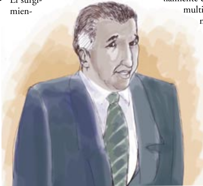
Reconocimiento explícito de la multiculturalidad y de distintos idiomas en las constituciones de los países.