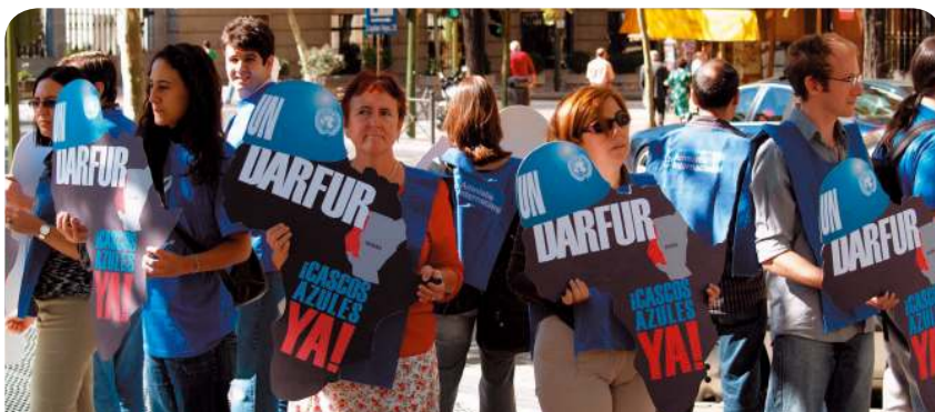
Acto de Amnistía Internacional para solicitar el envío de cascos azules a la región en conflicto de Darfur, en Sudán.

Solamente podremos decir que alguien fue un benefactor de la humanidad o un impresentable tirano desde las coordenadas de los valores que dieron sentido a su vida. Una misma herencia genética puede dar lugar a gente tan dispar como Hitler y Gandhi: lo que los distingue son sus valores, su comportamiento.