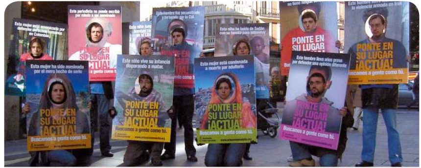
Con motivo del 58 Aniversario de la Declaración Universal de los Derechos Humanos, activistas de Amnistía Internacional organizaron un acto de calle para recordar las principales preocupaciones que la organización tiene en relación a la violación de los derechos humanos en todo el mundo.

Material necesario: Artículo 19 de la Declaración Universal de los Derechos Humanos: “Todo individuo tiene derecho a la libertad de opinión y de expresión” . Textos de situaciones y Hoja de observaciones (Ficha 2, página 20).