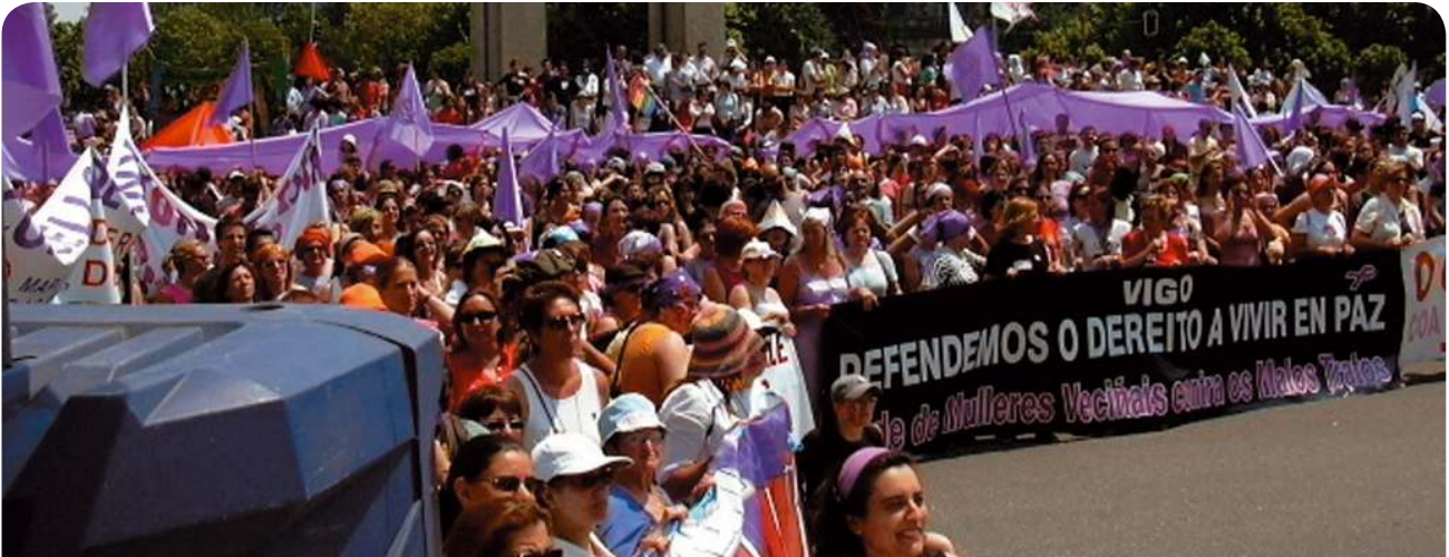
Manifestación en Vigo contra violencia doméstica y la discriminación de las mujeres con el lema: 'Vigo, defendemos el derecho a vivir en paz'