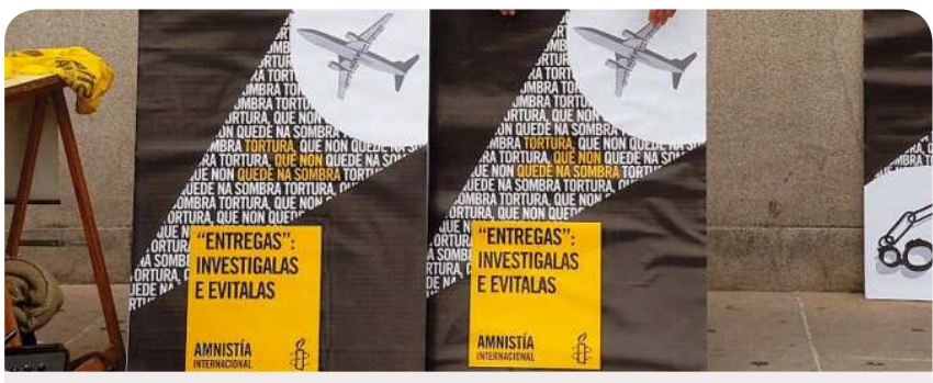
Amnistía Internacional pide el cese de las entregas extraordinarias de personas a países donde no se respeten sus derechos y garantías jurídicas.