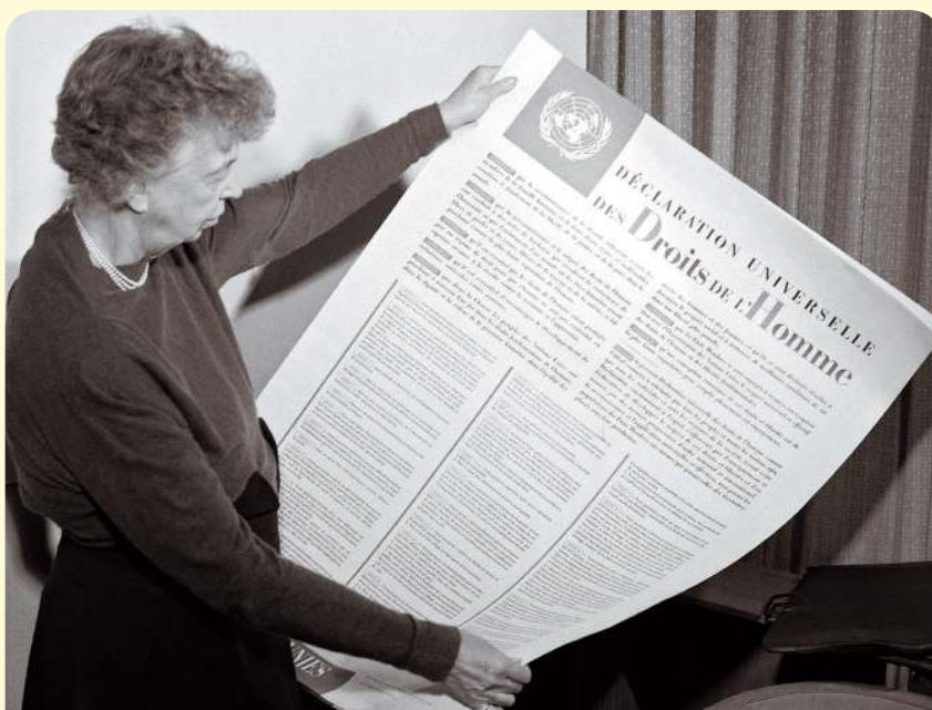
Eleanor Roosevelt, esposa del Presidente de los Estados Unidos Franklin Delano Roosevelt, diplomática y activista por los derechos humanos, sosteniendo la Declaración Universal de los Derechos Humanos.

El jefe de Policía está sometido a una presión creciente para encontrar a los responsables de la explosión del Parque del Milenio. El alcalde, los responsables de negocios perjudicados en el asunto del Parque del Milenio y la opinión pública reclaman acciones inmediatas para evitar otro ataque.