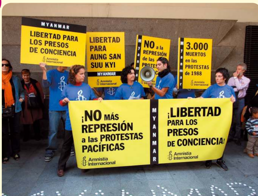
Acto de protesta contra la represión de manifestaciones pacíficas en Myanmar. Activistas de Amnistía Internacional pidieron, además, la puesta en libertad de todos los presos y presas de conciencia.

El mes pasado dos personas, John y Jane, afirmaron ser los líderes de la Brigada del Pan y la Libertad (BPL), un grupo terrorista. Fueron detenidos como sospechosos de lo ocurrido en el Parque del Milenio, en la periferia de París. En el atentado murieron ocho menores, que iban de viaje escolar desde el Reino Unido, y otros tantos sufrieron lesiones graves. La policía afirma que ha recibido una amenaza del BPL de que realizarán acciones similares cada mes, si no se cumplen sus reivindicaciones.