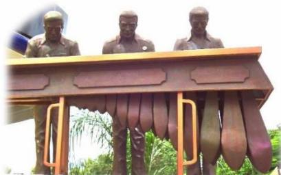
Foto: Monumento a la Marimba, Santa Cruz, Guanacaste

La marimba es el instrumento musical que más ha conquistado el corazón del pueblo guanacasteco. Alegra los casamientos, los turnos, las fiestas cívicas y religiosas en toda la provincia. El Decreto N° 25114-C del martes 3 de setiembre de 1996, en su Artículo 1º- declara la marimba como instrumento musical nacional.