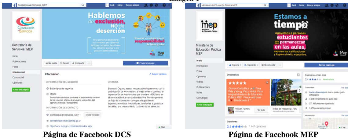
Página de Facebook DCS