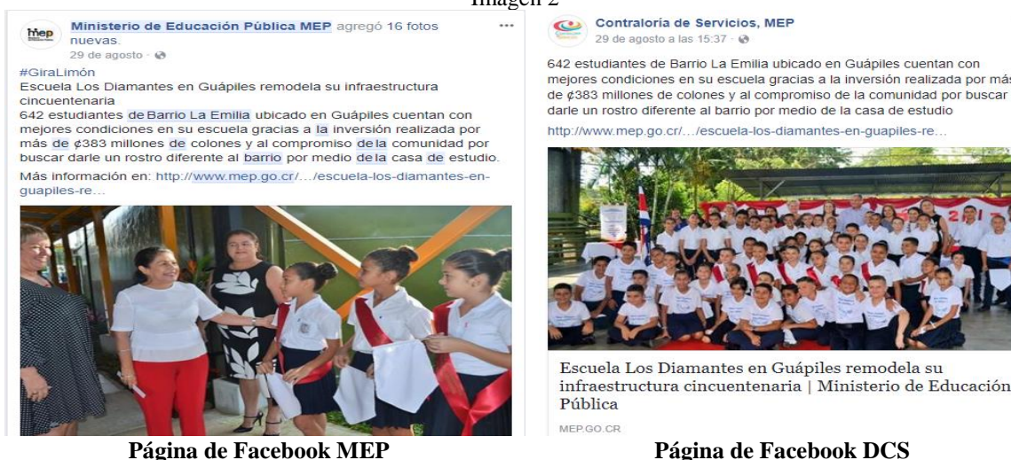
Página de Facebook MEP