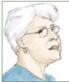
Violeta Barrios, nicaragüense, primera mujer en Centroamérica en ocupar la Presidencia de la República.