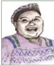
Rigoberta Menchú, indígena guatemalteca, acreedora del Premio Nobel de la Paz en 1992.