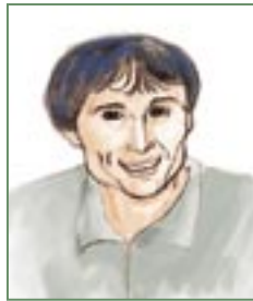
Franklin Chang, astronauta costarricense.

naciones centroamericanas. Se trata, en primera instancia, de personas reconocidas tanto en el contexto regional como en el mundial: