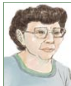
Clementina Suárez, poetisa hondureña.